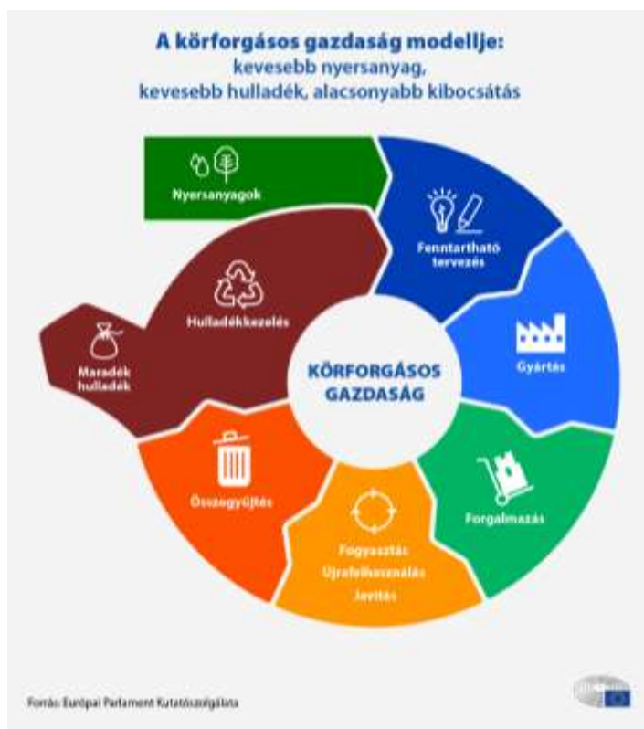
1. ábra: A körforgásos gazdaság modellje

hanem gazdasági előnyöket is nyújt, például költségmegtakarítást és új üzleti lehetőségeket. (Bihoux, 2020)