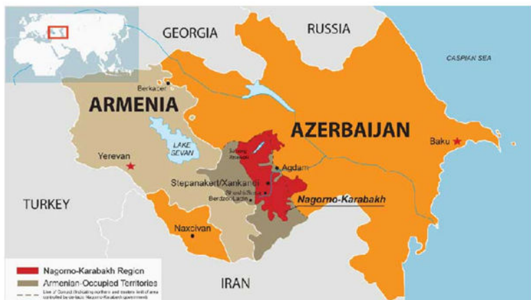
1. ábra: Karabah a 2020-as második karabahi háború előtt

Utólag visszatekintve úgy tűnik, hogy az örmények számára a karabahi végjáték kezdete 2018-ra volt tehető. Ebben az évben megbukott az Örményországot két évtized óta irányító „karabahi klán” és a jereváni „bársonyos forradalom” a nyugatos Nikol Pasinját emelte a miniszterelnöki székbe. Oroszországot, melynek a kétezres évektől kezdve a kapcsolatai amúgy is rohamosan javultak Azerbajdzsánnal, mélységesen irritálta az orosz szövetségesnek hitt Örményországban lezajló „színes forradalom”. Így a putyini hatalom retorikailag látványosan felhagyott az örmény oldal támogatásával, sőt Örményországot a Karabahon kívüli megszállt körzetek (Lacsin, Fizuli, Agdam stb.) kiűritésére szólította fel (Ergun – Valiyev, 2020). A nemzetközi csillagállás nem alakult kedvezően a hatalmi vákuumba kerülő Örményország számára. Oroszország politikai támogatását elveszítették, a nyugati nagyhatalmak, mindenekelőtt az USA azonban nem sietett aktivizálni magát. A NATO és az EU egyaránt semlegességüket deklarálták a karabahi konfliktusban, egyedül a számottevő örmény diaszpórával rendelkező Franciaország nyújtott érdemi segítséget a kontinentális bezártságtól szenvedő, elszigetelt és szegény kis kaukázusi államnak. Az örmények az ENSZ-től sem remélhettek politikai támogatást, a nemzetközi jog egyértelműen Azerbajdzsán területi