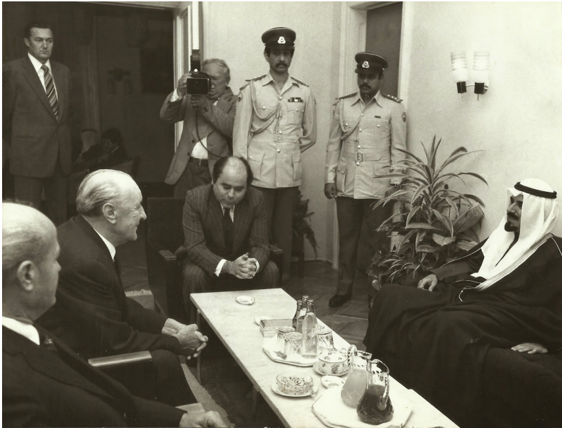
Kádár János és Dzsáber Al-Ahmed Al-Dzsáber Asz-Szabáh sejk találkozója

Mindezekén túl a felek egyetértettek a két ország közötti kereskedelem volumenének növelésében is. Utóbbira a kuvaiti kereskedelmi és iparügyi miniszter főleg az élelmiszer-ellátás terén tartotta kedvőnek a kilátásokat, amihez ugyanakkor elengedhetetlennek tartotta a folyamatos és kiegyensúlyozott szállítások biztosítását. Emellett ígéretet tett a városi autóbuszok értékesítésére tett magyar ajánlatok illetékeseknek történő továbbítására, amelynek eredményeként a magyar fél megrendelést is kapott rövid idővel a látogatást követően [58].