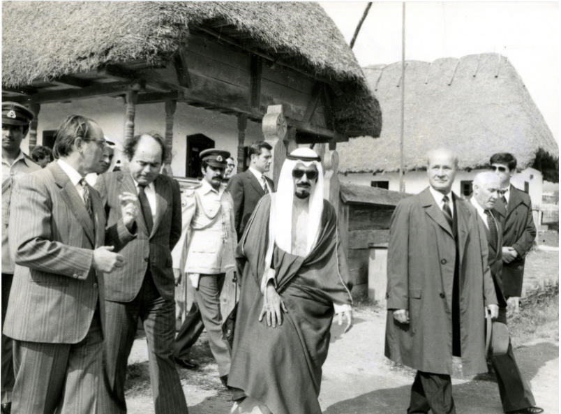
Képek Dzsáber Al-Ahmed Asz-Szabáh sejk és kíséretének a Duna-kanyarban tett látogatásáról