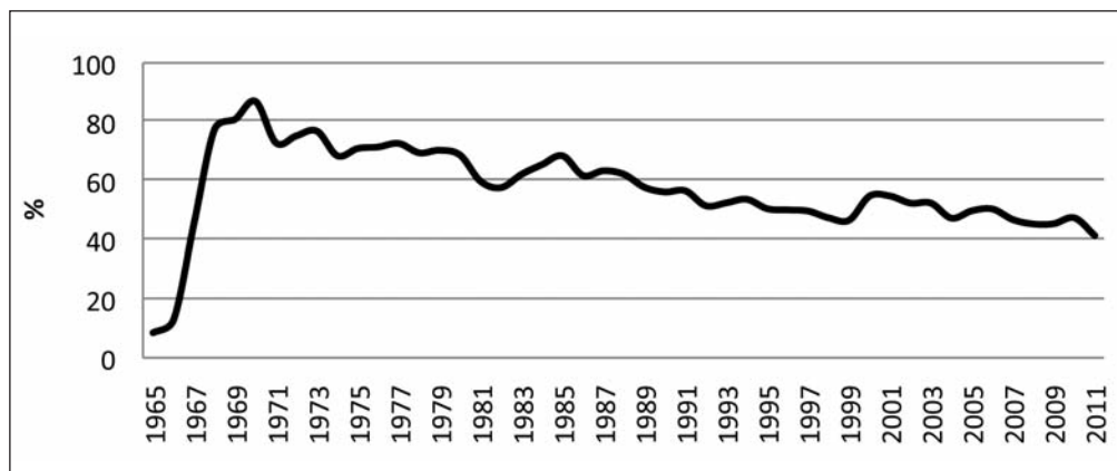
3. ábra: KAP támogatások az EU költségvetés százalékában (1965-2011)

Forrás: EU Budget Financial Report 2008, 2009, 2010, EU 2011