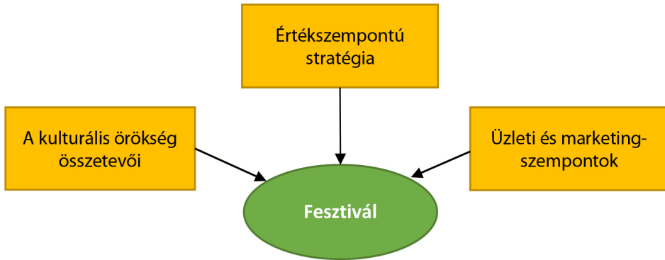
3. ábra: A fesztiválok elhelyezése a kulturális örökség összefüggésében

be, amely erősíti a kulturális turizmust és a hozzá kapcsolódó fesztiválgazdaságot. Felhívjuk a figyelmet három fontos dimenzió egymásba fonódására (lásd 3. ábra):