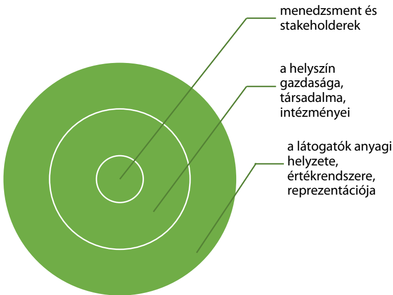
2. ábra: A fesztiválgazdaság színterei

portjai. Tihany esetében a képlet összetettebb, mivel a helyi társadalom sem egységes, és a megjelenő turisták is eltérő reprezentációkat csatolnak a félszigethez. A „véletlenül beeső” turistákat leszámítva a vendégek többnyire azt a képet keresik, ami kialakult bennük a személyes vagy a tömegkommunikáció vagy az internet által „kultivált” információk alapján (Halfacree 1993, 1995). Mindkét esetben van mód arra, hogy a reprezentációkat, tehát jelen esetben a kastélyról és Tihanyról kialakult képeket alakítani lehessen a megfogalmazott stratégiának megfelelően (Wassler et al. 2019). Elsősorban oly módon, hogy összekapcsolódjanak a „külső társadalom – látogatói csoportok” és a „belső társadalom – Tihany esetében az állandó és nem állandó helyi lakosság, valamint a fontos turisztikai szereplők, a Károlyi-kastély esetében pedig a többféle funkciót képviselő menedzsment” által kialakított reprezentációk.